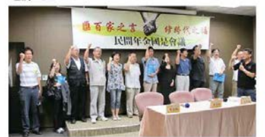
工會團體積極參與民間年金國是會議

以來，各種樂別被盡分畛域，大眾逐漸喪失了關懷彼此、接納對方的能力，參與的各團體在行前記者會誓言：這一次，要把它找回來！