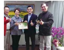
只幫忙私校退撫新制在98年6月三讀，在月中，黃委員逐條守護，為公私校教師待遇給付更用心良苦，是把承諾當作生命