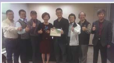
陳淑慧委員：為了建構好的教育制度，使委員最有耐心傾聽各界想法，不單以靠徵行政部門意志為意志，為了公保專業過關，他在折衝時即使被同僚誤解吃味，也在所不措。