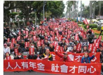
全教總發動「0110私校年金行動」，對公保年金化至為關鍵

很多公校老師與會幹部，更在此事投下了關心、支持與真誠，出錢出力又出人，令人深深感受其關愛支持弱勢的寬廣與決心，相信今後再也不會有人亂說「教師(工)會只處理公校的事，私校幹啥參加？」「別傻了，幹啥交錢？他們又沒有我們做什麼？」事實證明教師組織有價有義，而且具備實際守護弱勢的能耐，是絕對值得我們加入並引以為傲的優質組織！