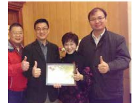
無論在那個位置，都不曾忘記健全私校退撫基金應到執政黨中央，乃至法憲協商的是教育人的厚實支柱，永遠是教育界最正義。