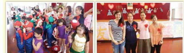
台師大特教系特教志工們的、檢決、君學、樂學，參加他們協助的小朋友的畢業典禮。

本會「中小學特教協助志工」102學年度下學期，計服務台北地區學校：高職1校、國中5校、國小14校；服務型態如下：入班協助：特教班3班、資源班1班、普通班1班；離班個別輔導：33位學生。 本計畫開辦五個學期以來，共有一百餘位志工進入台北地區約三十多所學校服務；服務人次累積超過1329人次，服務時數超過3890小時，恭賀各校好評。