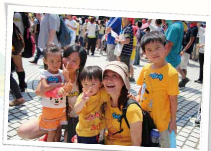
親子參加孩子的天空大合唱