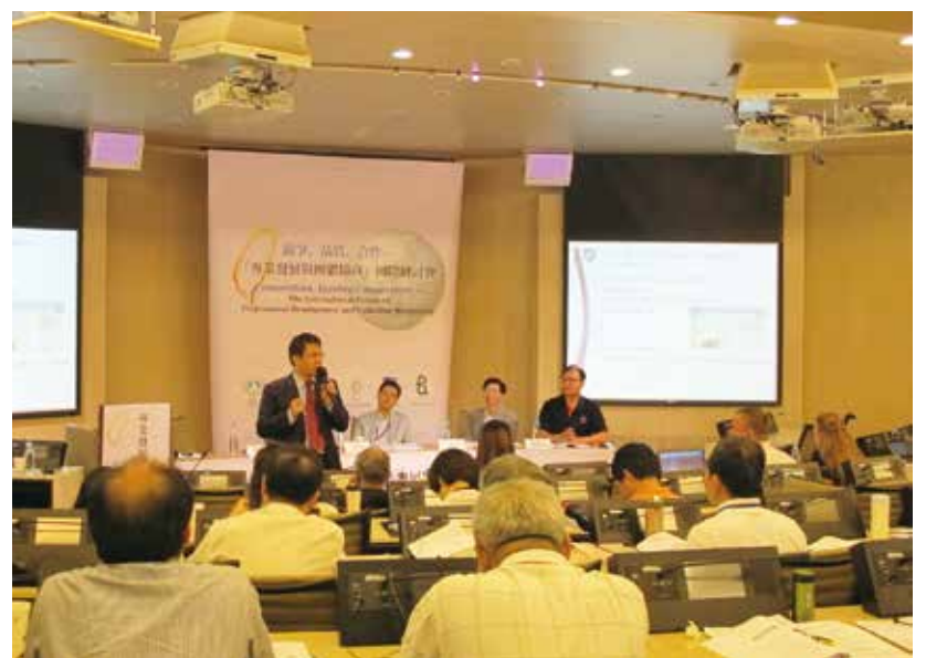
教育部長蔣偉寧參與討論