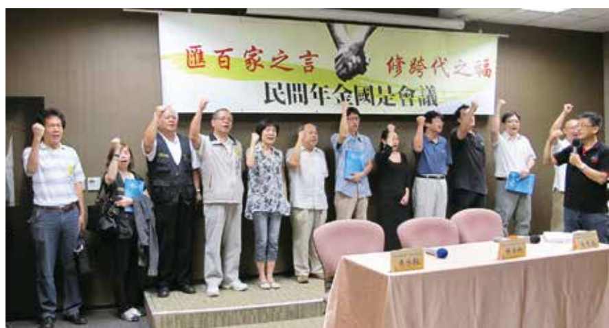
工會團體積極參與民間年金國是會議

以來，各職業別被畫分畛域，大眾逐漸喪失了關懷彼此、接納對方的能力，參與的各團體在行前記者會誓言：這一次，要把它找回來！