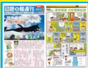
《國語日報週刊進階版》