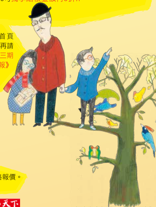
圖取自/東方出版《小蝙蝠找朋友》

即日起-11/30，特價促銷5折起，全館憑本會會員證號消費滿$1,500可獨享結帳金額再9折!!