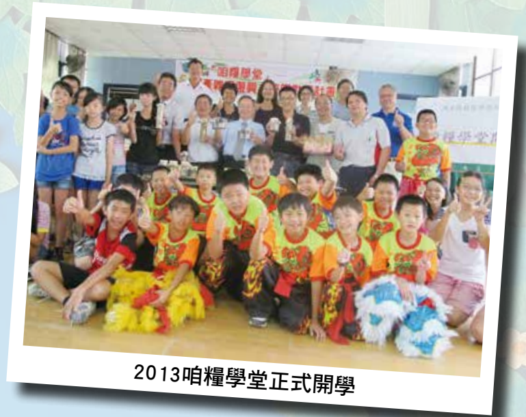
2013咱糧學堂正式開學

事實上，全國各地有許多進步團體與自主公民，早就已具體行動支持小農與本土農業，全教總做為教育專業團體，未來會持續努力，將教育與土地、農業做更友善的結合，也呼籲政府以更具體的作為，社會各界能以更有力的行動，支持台灣本土農業，落實食育教育。