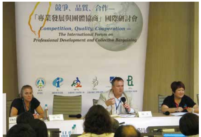
AFT(美國教師聯盟)兩位代表來台分享美國經驗