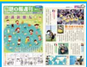
《國語日報週刊初階版》