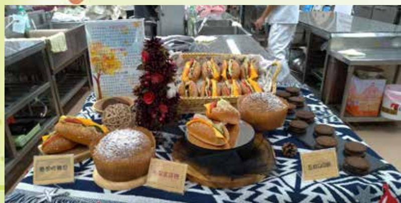
▲參賽選手作品I—如何用臺灣小麥的獨特筋性做成美味麵包，是一大挑戰。