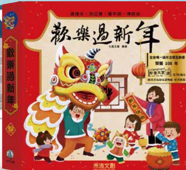
歡樂過新年 立體書 熱賣中