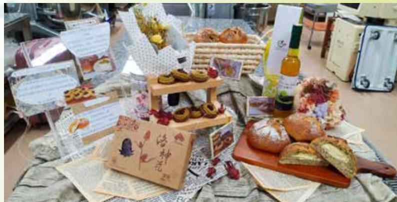
▲參賽選手作品II—除了做出健康又好吃的麵包，布置的設計感也是評分標準之一。