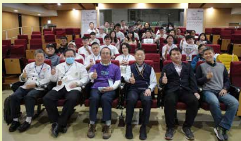
▲來自全台灣的選手齊聚一堂，交流學習，共享榮耀。

*由財團法人育秀教育基金會主辦，全國教師工會總聯合會協辦，共分為職業組、大專院校組、高中職組。經過初賽後，選出15位晉級的優勝者(今年有三組指導老師亦為全教總會會員)，決賽須以現場製作方式進行，當天即公布評審結果並頒獎。