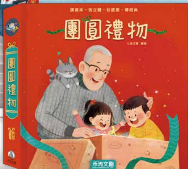
團圓禮物 2022年1月 新書上市