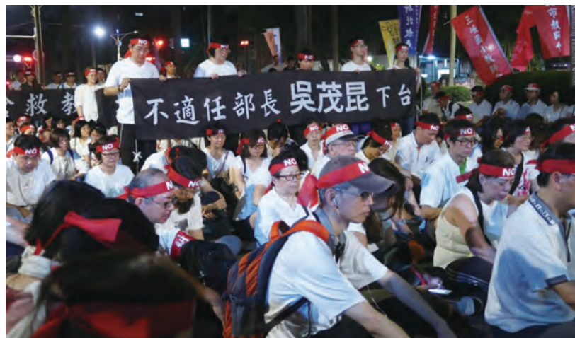
圖/ 108年5月18日，全教總與所屬地方工會發動逾千名會員教師集結教育院高喊「不適任部長吳茂昆下台」。

108年5月6日全教總動員到國家教育研究院11樓課審大會場外抗議，108年5月18日發出動員令，號召逾千名會員教師包圍教育部高喊「不適任部長吳茂昆下台」同月29日吳茂昆向行政院請辭獲准。