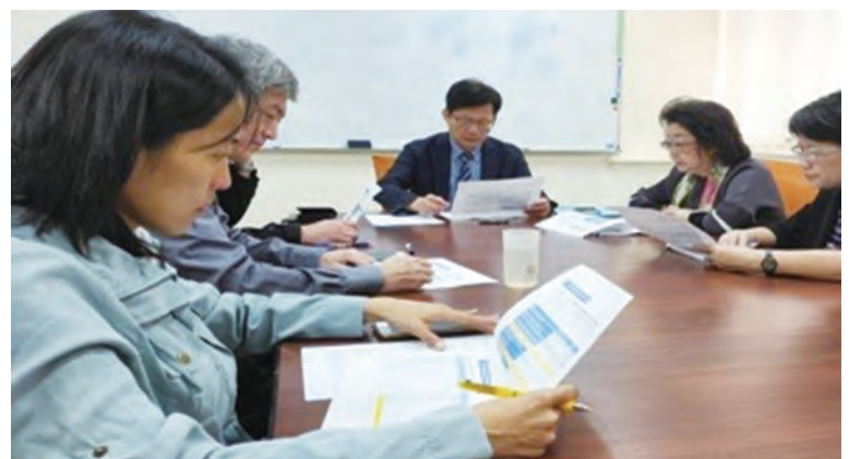
圖/ 107年「研議未具一年實務工作經驗技職教師參與介聘補救方案」協調會，左至右依序為：全教總政策部主任殷童娟、全教總法務中心執行長林金財、立法委員張廖萬堅、教育部政務次長范巽綠、國教署副署長戴淑芬。

即依據「技術及職業教育法施行細則」第6條第2項規定，於民國104年至108年間聘任高級中等學校專業科目或技術科目之專任教師但未具業界實務工作經驗者，申請介聘時，不受「技術及職業教育法」第25條第1項所定1年以上與任教領域相關業界實務工作經驗的拘束，得依高級中等學校教師介聘規定申請教師介聘。