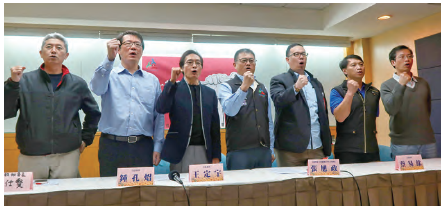
全教總開記者會，工會夥伴、立委來讚聲!!