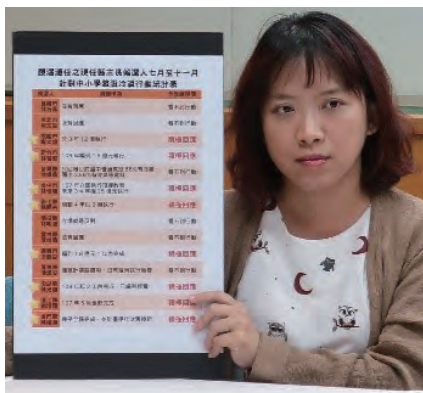
全教總公告自七月至十一月間，縣市長候選人針對中小學教室裝設冷氣之行動現況統計表