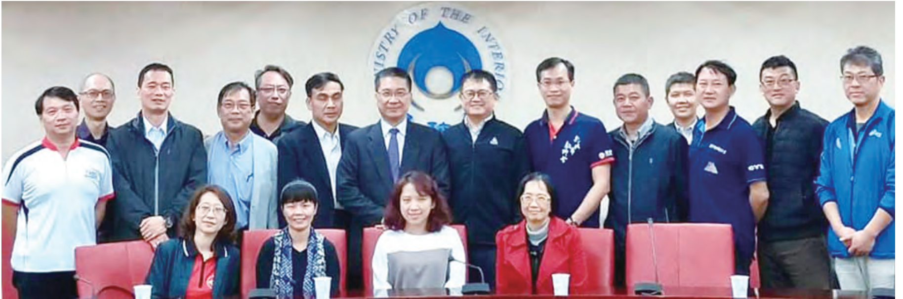
內政部長徐國勇會見全教總幹部及各縣市工會理事長

有些人或許會質疑，做為教師組織，為什麼不是要求教師節放假一天，而是要求將勞動節訂為全國性的假日？因為，這個訴求的真正意義，不只是為了多放假一天，而是和整個社會的脈動、人民的生活扣連在一起。一個無法重視勞動價值的社會，還能期待人民尊師重道嗎？尊重每一種勞動，才能尊重每一種職業，這是我們的信念！！