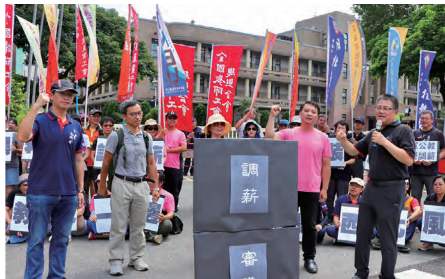
圖/108年7月16日，全教總至行政院前陳情，調薪實為合理之訴求