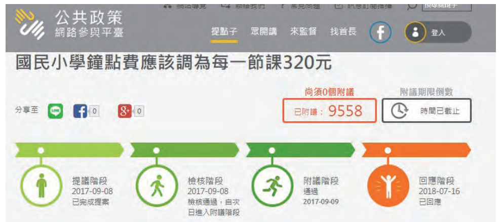
圖/ 106年9月8日全教總在「公共政策網路參與平臺」發動會員連署，訴求「國民小學鐘點費應該調為每一節課320元」。

108年1月1日確定國小代課鐘點費將由現行260元增為320元，106年9月8日全教總在「公共政策網路參與平臺」發動會員連署，並於數小時內即完成5000人次連署，107年7月4日經行政院完備程序後108年上路。