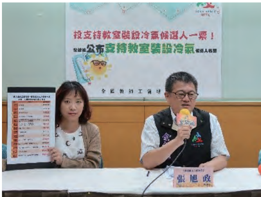
全教總呼籲選民投給支持中小學校教室裝設冷氣之縣市長候選人一票

對於普遍性的教育需求，全教總也要呼籲中央政府必須更為主動，避免地方政府貧富狀況影響學生學習權益，既然這是絕對多數地方政府都要做的事，就應該負起這個屬於國民基本教育的責任，切莫急著用經費需求太大搪塞！