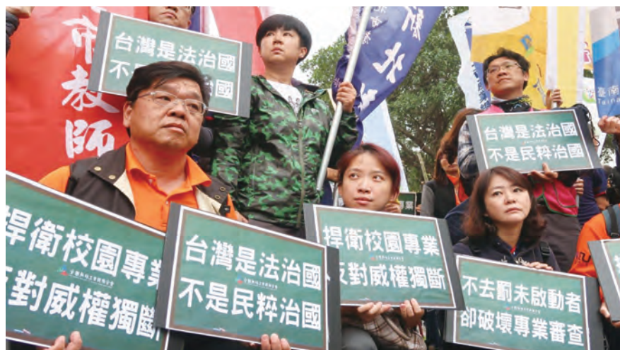
圖/ 108年4月15日，立法院教育文化委員會進行教師法修正草案詢答及逐條討論，全教總與所屬地方工會集結立法院抗議。