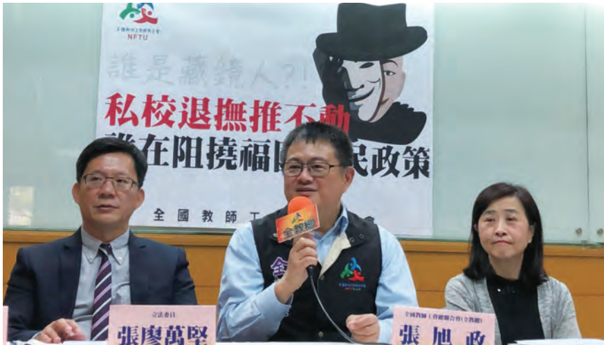
圖/ 108年3月20日「誰是藏鏡人?!私校退撫推不動，誰在阻撓福國利民政策」記者會，左至右依序為：立法委員張廖萬堅、全教總理事長張旭政、立法委員林奕華。

107年起全教總推動私校退撫條例修訂個人增額提撥自主化（第9條）、人生週期基金預選(第10條)，以及退休金續留（第20條）等彈性措施，全教總與所屬地方工會多次拜會及遊說，立法院司法及法制、教育及文化委員會108年3月27日舉辦聯席會議，108年4月9日三讀通過，感謝立法委員張廖萬堅、立法委員陳學聖以及立法委員林奕華，協助法案的推動，讓私校教師的年金制度更加完善。