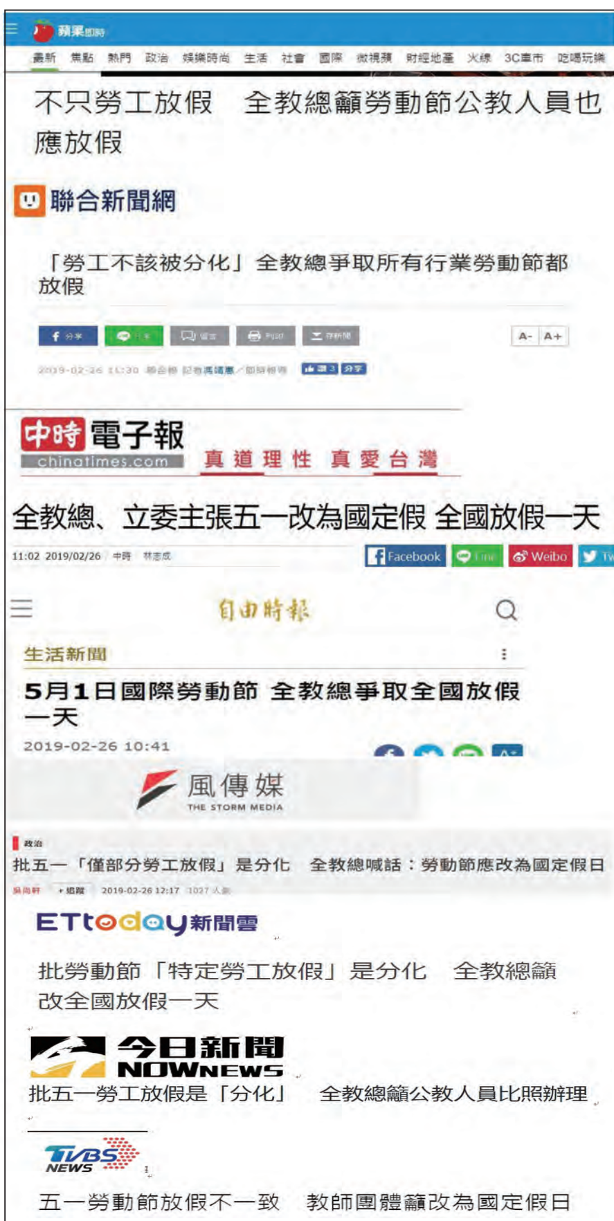
「五一改為國定假」成為各大媒體熱點