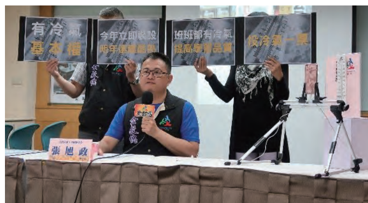
全教總召開中小學教室裝設冷氣之記者會