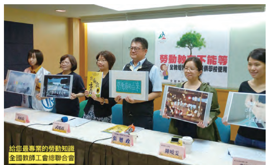
給您最專業的勞動知識 全國教師工會總聯合會

抑且固守法定原則，僅限於審查協約是否違反強行法，不應涉及合理與否的合目的性，尊重當事人之原始內容為原則，不予核可必須為絕對的例外。相反的，如是行政組織法上的內部上下監督行為，則可能可以證立兼具合法性、合目的性之雙重審查，然立法上的原意是否真的如此？是否反而造成前階段協商之無意義、非誠信？如上級機關在協商階段曾經參與一例如縣市政府教育局接受學校委託而代理協商，嗣後抵觸「矛盾禁止原則」而不予核可，則可能成立不當勞動行為或違反誠實信用之行政行為，實不可不慎。