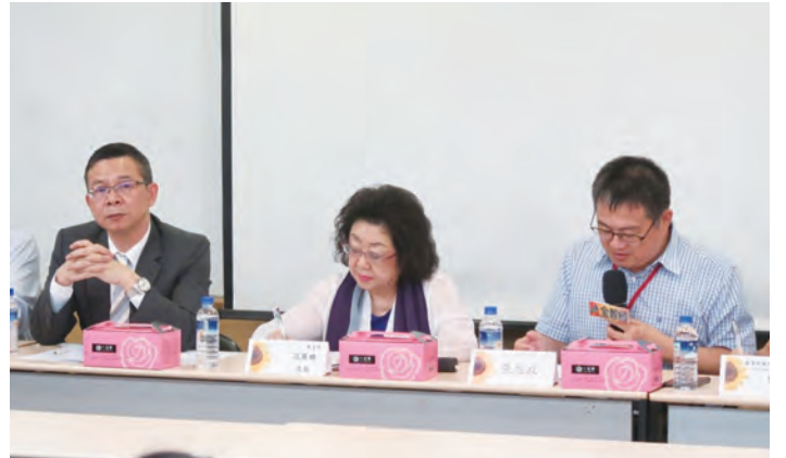
圖/ 107年10月9日全教總辦理「高級中等學校教育政策與議題」研討會，左至右依序為：時任國教署署長邱乾國、教育部政務次長范巽綠、全教總理事長張旭政。

介聘但書入法採計育嬰兵役年資，全教總與立法委員費鴻泰、立法委員黃國書、立法委員何欣純、立法委員許智傑、立法委員張廖萬堅及立法委員柯志恩，自民國104起達成介聘但書緩衝及入法，採計育嬰及兵役年資。