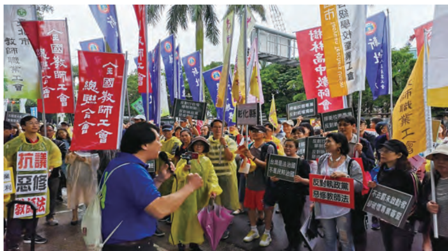
圖/ 108年5月1日，立法院教育文化委員會審查教師法修正草案，全教總與所屬地方工會號召逾500名會員教師包圍立法院。

108年3月8日民進黨團幹事長管碧玲隨即發出聲明表示，以上內容未跟教師團體達成共識，本次修法不會處理。108年4月29日全教總及所屬會員工會於議案審查同時，動員場外強力施壓及場內積極遊說下，立法院教育文化委員會確認刪除涉爭議條文，同時再度擋下教師評鑑入法。