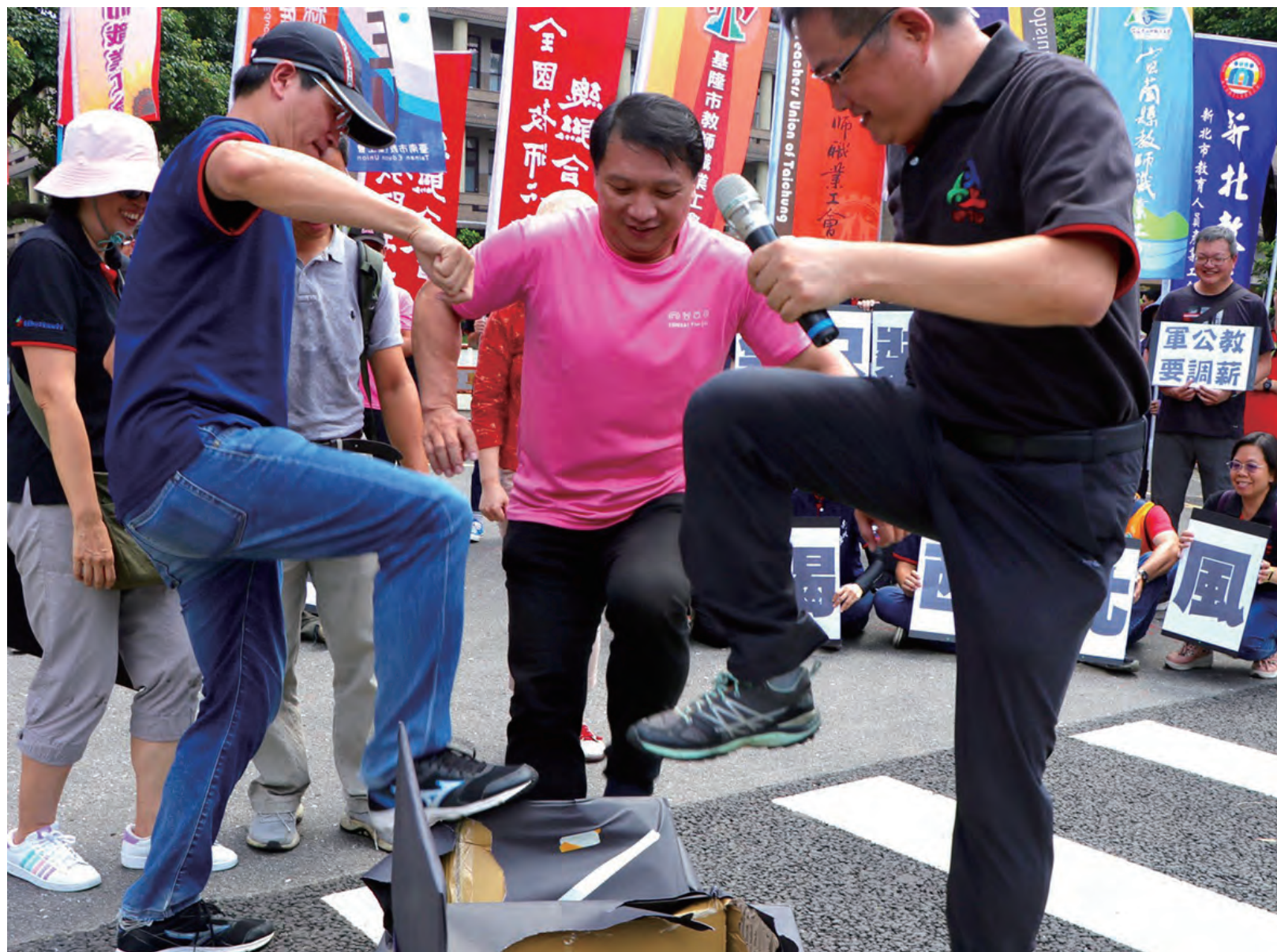
圖/全教總誓言打破調薪審議的黑箱作業

雖然今年爭取調薪不成，但全教總成功讓軍公教薪水成為一個應該有合理調整機制的議題。而我們不僅提出了應該參考重要經濟、民生數據，更主張行政院軍公教待遇審議委員會應該要有軍公教的代表在內，以打破目前完全不知道委員是誰、調整與否的理由為何的黑箱作業。