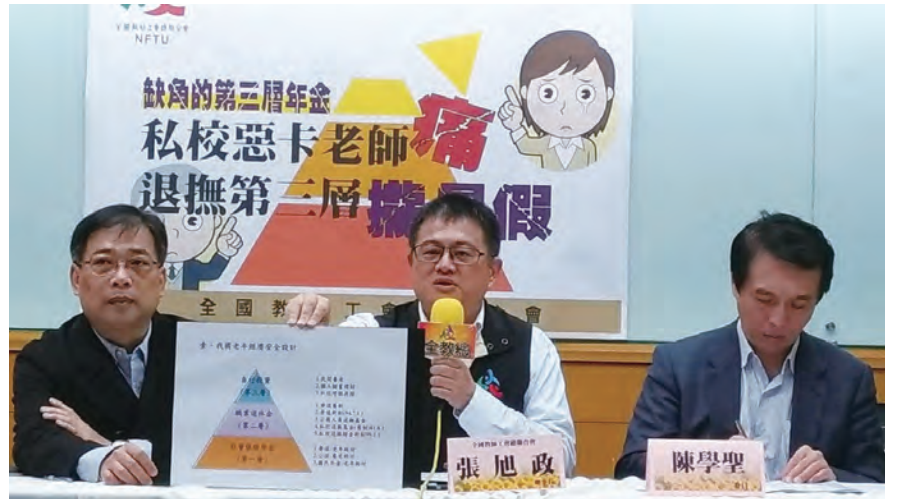
圖/ 107年3月23日「缺角的第三層年金，私校增額提撥受學校刁難，應修法以健全退撫制度」記者會，左至右依序為：全教會副理事長陳建志、全教總理事長張旭政、立法委員陳學聖。