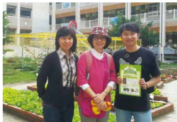
拜訪台北市清江國小。美麗咱糧田

如果種植失敗怎麼辦？是不是就浪費種子了？真的都不會，也能申請嗎？……只要有心，哪怕是一個小盆栽，也能種出美麗的麥穗。當我聽到很多老師告訴我：「真不敢相信自己也能種出一片紅藜、一片麥田和蕎麥」，那種興奮的表情，我就知道，咱糧學堂是很棒的課程了。