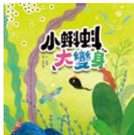
圖 | 黃祈嘉 · 文 | 吳周