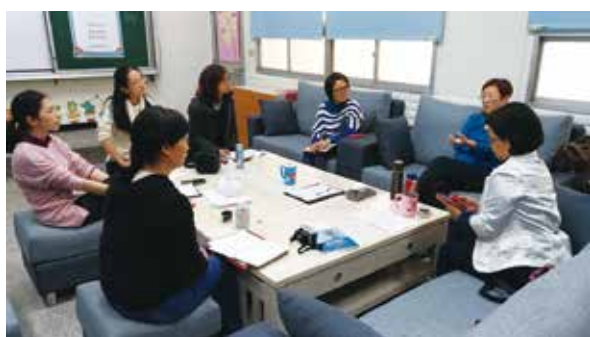
從議課對話中提煉教學專業