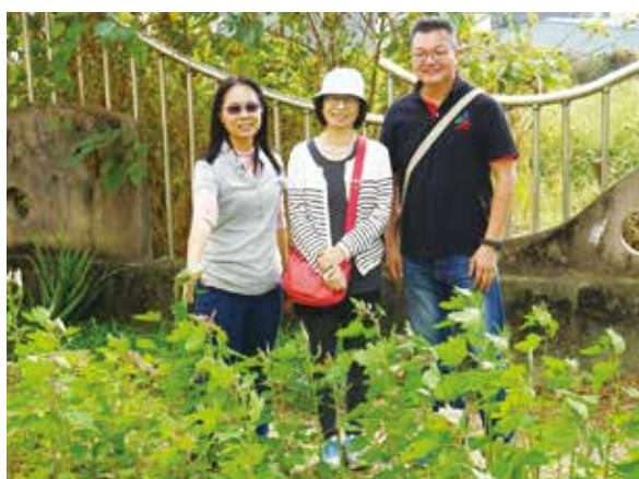
拜訪屏東縣東光國小。紅藜盛開