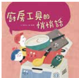
圖 | 陳佳蕙 · 文 | 微笑先生