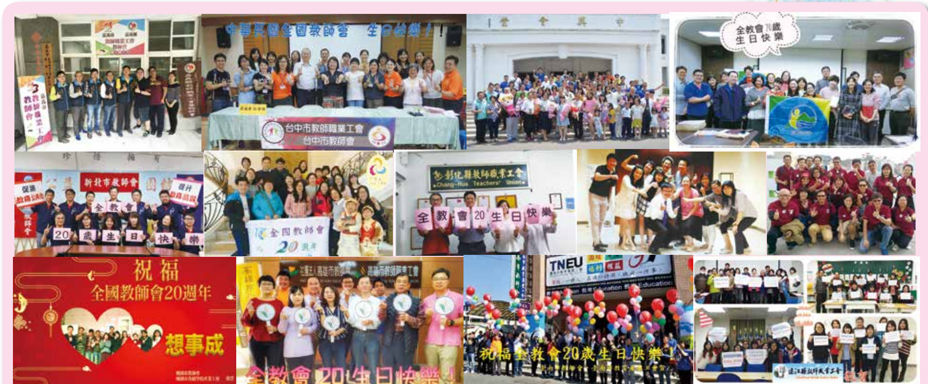
來自各縣市的祝福～全國教師會，20歲生日快樂！