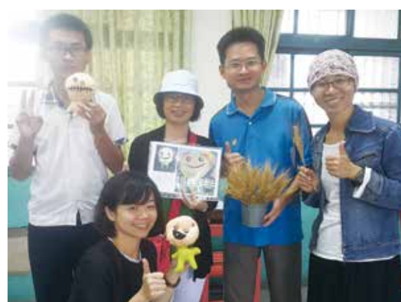
拜訪彰化縣社頭國中。製作大麵神娃娃