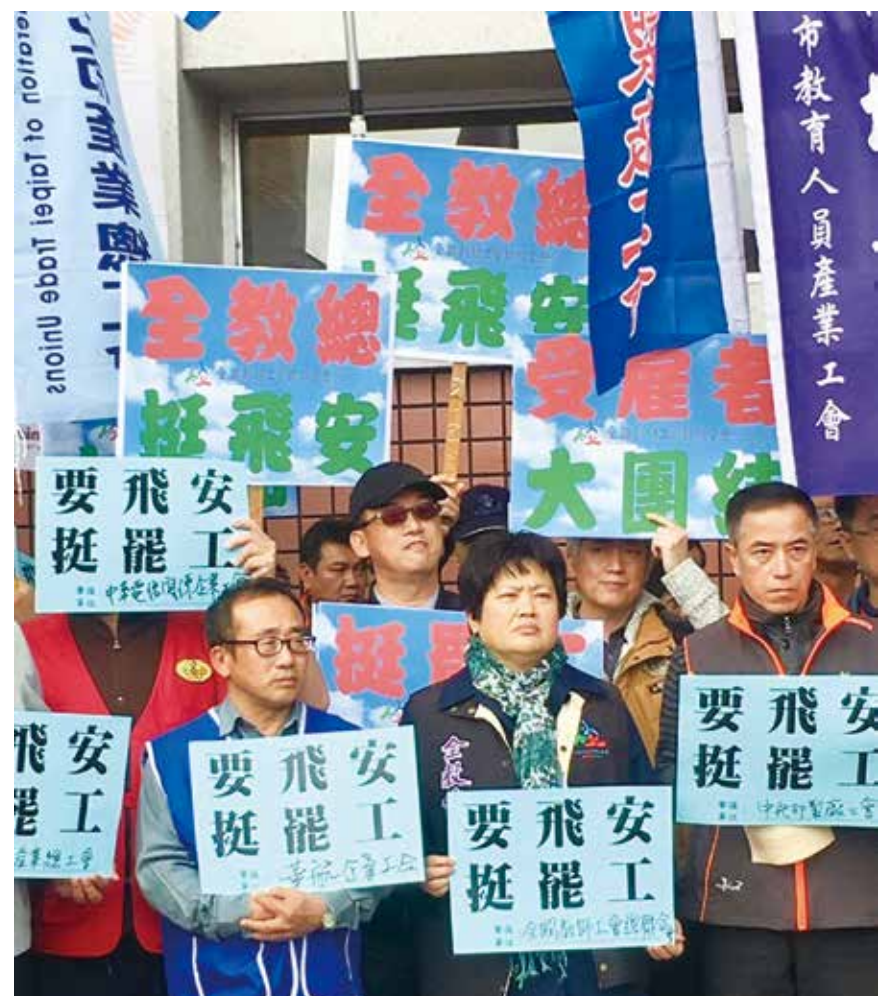
全教總聲援華航機師罷工行動