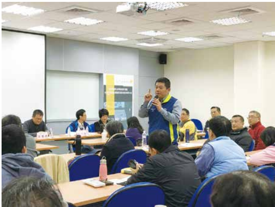
本會辦理專審會案例研討會