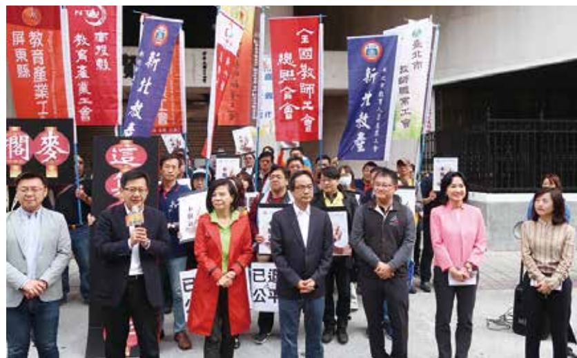
朝野立委齊來聲援，允修法改善

金永續無關的補償性措施，卻在這次年改中把在職公教完全刪除，這種不公平的改革，已讓現行在職約14萬資深公教形成一股怨氣。全教總呼籲朝野立委，應理解補償金有其歷史脈絡，是立法院通過的過渡性措施，有其正當性與合理性；更應認清本次年改刪除在職公教補償金是不公平的改革。對符合領取補償金的14萬現職公教來說，唯有回復補償金才合理，也才符合年改不降低政府支出的原則。