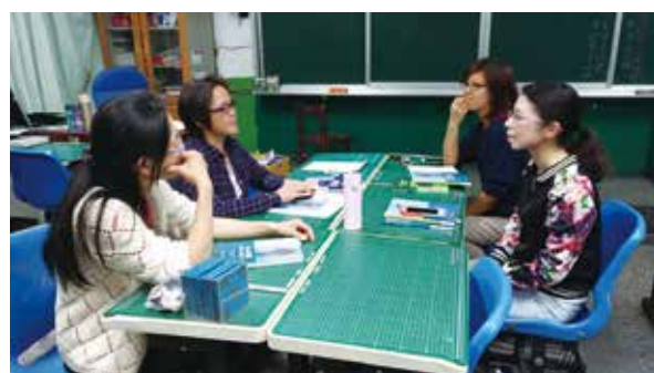
夥伴們針對核心問題提出自己的想法