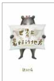
圖 · 文 | 顏銘儀