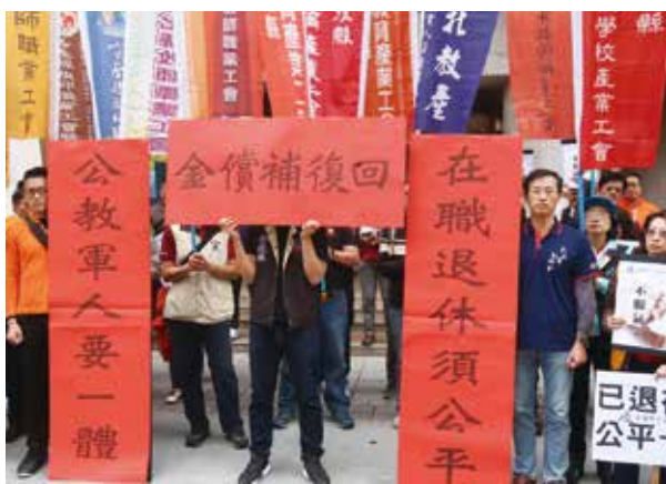
全教總所屬各縣市工會代表至立法院抗議，要求回復補償金