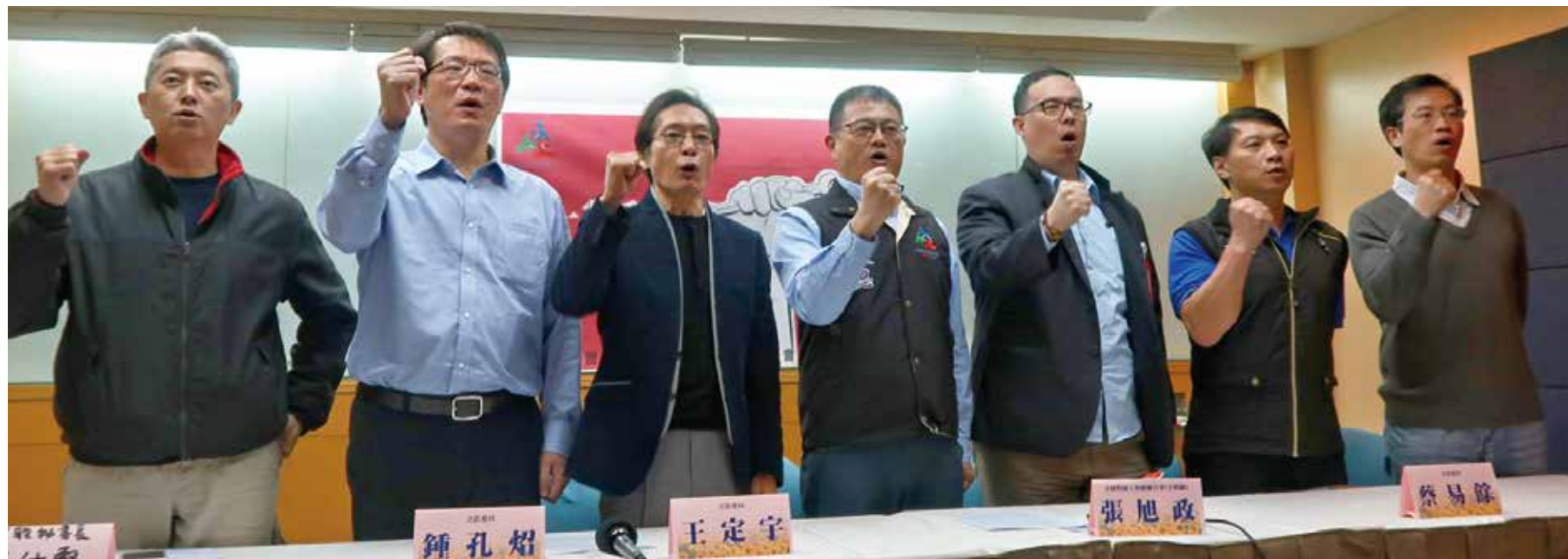
召開記者會「五一應為國定假日」

五一勞動節是勞動者的重大節日，為稱許勞動者對於國家社會經濟的重大貢獻、為感念勞動者先賢的智慧與勇氣，並彰顯勞動者集會結社團結力量的展現。在臺灣，長期以來，教師受制於國家法制，無法組織工會，未得能具有完整的勞動三權。全教會自1999年成立，即已為臺灣教師集會結社的團結建立典範，並長期關懷勞動權益，此外，教師亦是勞動者，每位教師都應具備完整的勞動人權理念，才能帶領我們的學生成為未來國家重要的勞動者，並能維護與實踐個人與集體勞動權益的價值。未來，全教會與全教總會持續推動修法，讓同為受雇者的教師，亦能在「五一勞動節」共同紀念勞動歷史，真正落實勞動人權。