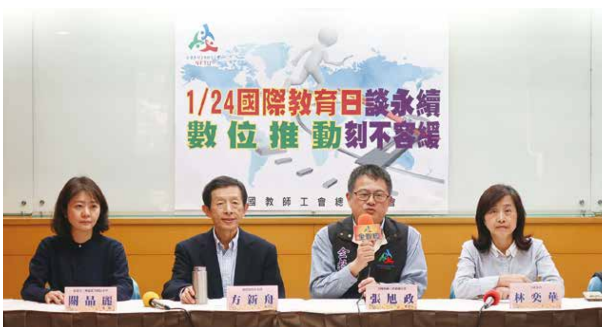
召開記者會，國際教育日談數位推動刻不容緩