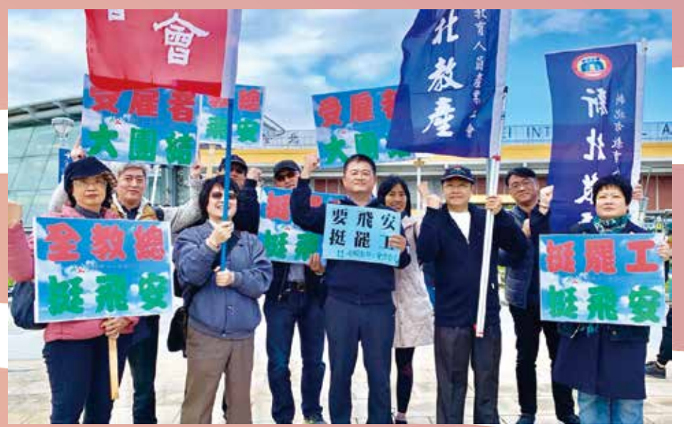
全教總聲援華航機師罷工行動