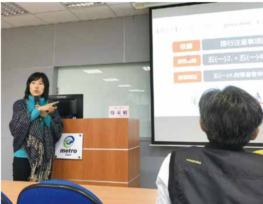
本會辦理專審會案例研討會