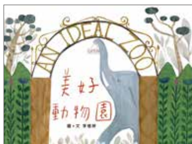
圖 · 文 | 李憶婷