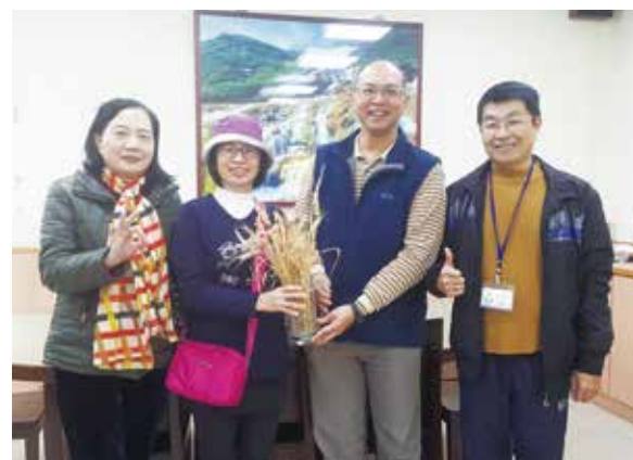
拜訪新北市三多國小。麥穗盆栽