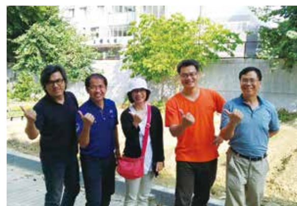
拜訪南投縣旭光高中。開始整地了