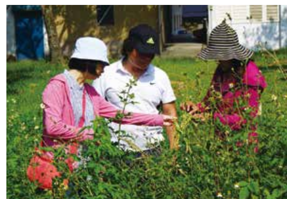
拜訪花蓮縣大榮國小。欣賞蕎麥