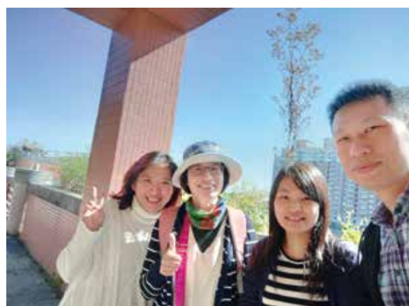
拜訪桃園市光明國中。花台也能種雜糧喔