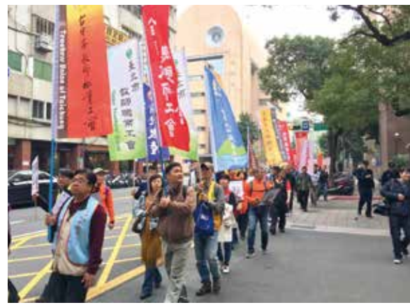
各工會代表遊行立法院一周表達補償金遭刪之不滿