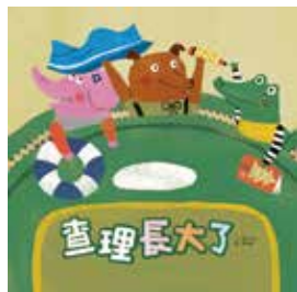
圖 | 陳佳蕙 · 文 | 微笑先生