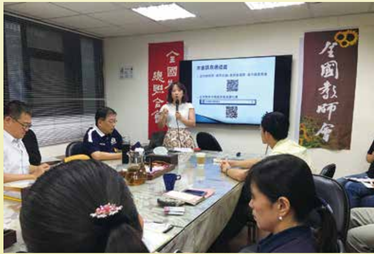
高中職委員會認真負責向各地方工會報告會務