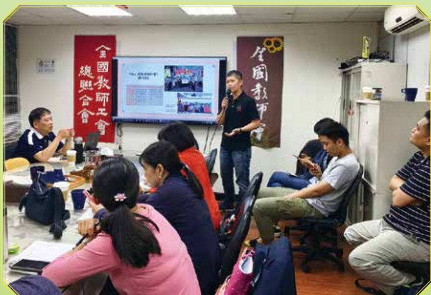
社發部向地方工會報告會務