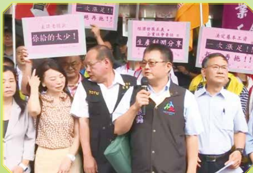
本會積極參與各公民團體行動-基本工資會議

我們說組織，組的是人，織的是理想，而這份理想終究要實踐於社會。當我扛著全教總旗幟，一次次站在街頭，聲援每個受壓迫的兄弟姐妹，總想到前南非總統也是人權鬥士的曼德拉說過：「教育是改變世界最強大的武器(Education is the most powerful weapon which you can use to change the world)。」改變社會從教育開始，而改變教育就從我們開始！