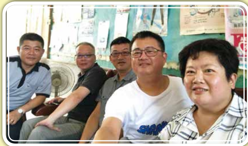
暑假期間本會走訪各地方工會，了解會務需求、與地方緊密相連