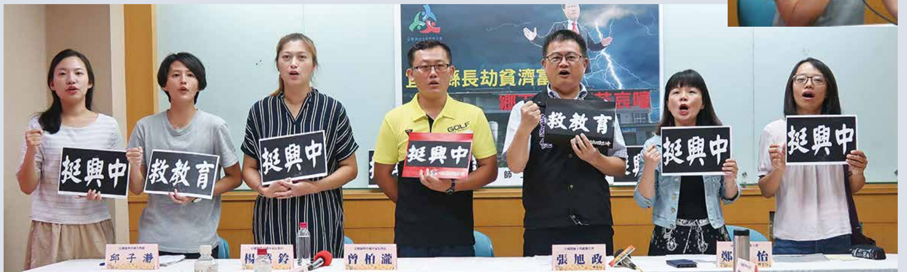
興中國中校舍爭議本會與宜蘭地方工會及學校代表合開記者會批陳金德角色錯亂、劫貧濟富