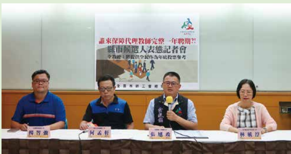
為代理教師發聲，聘期應一年記者會