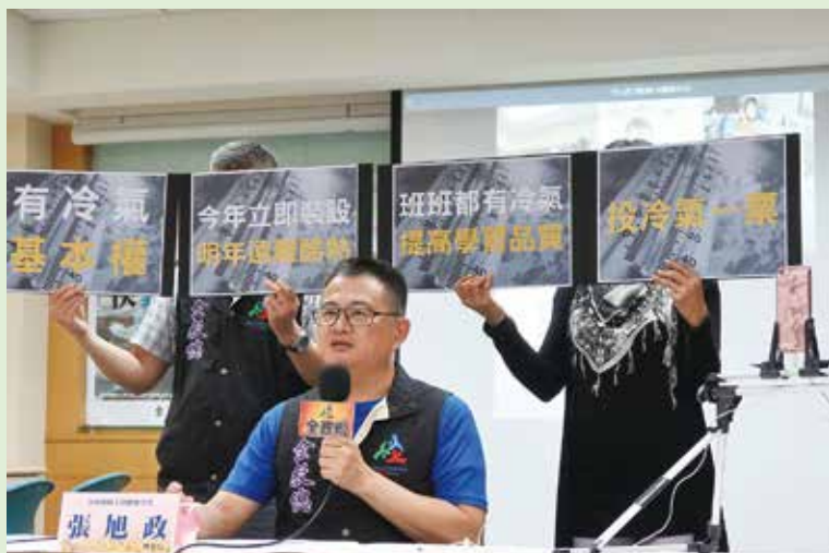
召開冷氣應為學校基本設備記者會