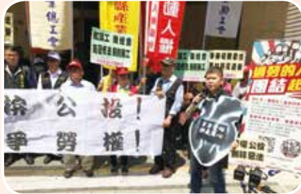
4月23日五一行動聯盟反過勞拼公投記者會