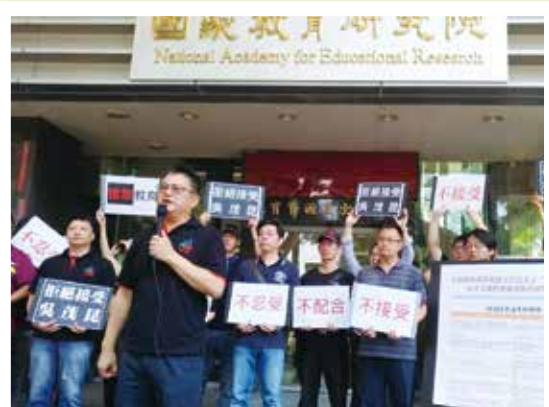
5月6日全教總至課審大會抗議吳茂昆是課綱反指標