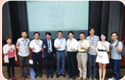
5月2日至桃園培訓專審會人才庫