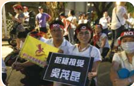
5月18日搶救教育部 捍衛教育的價值