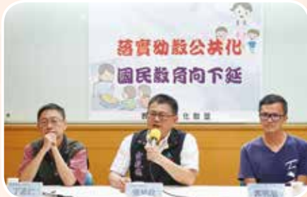
5月3日落實公共化國民教育向下延伸記者會