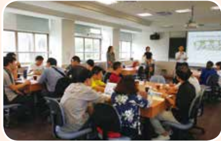
4月11日辦理高中學習歷程研討會