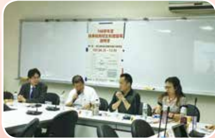
4月27日技專招生制度變革說明會