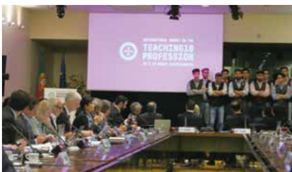
葡萄牙人聲合唱團 獻唱迎賓曲