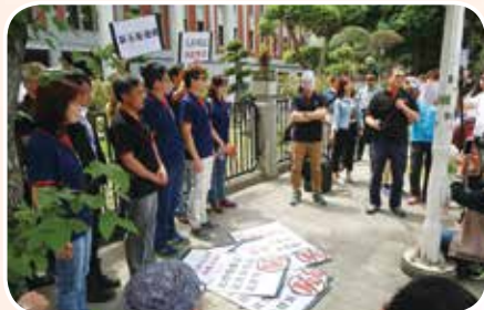
5月11日全教總發起新五恥運動反諷一切比照吳茂昆