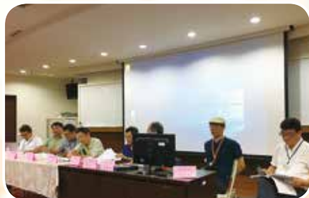
5月26日參加均優論壇與實驗教育推動者對話