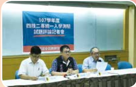
5月9日四技二專統一入學測驗試題評論記者會