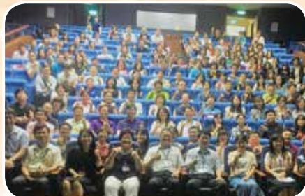
5月31日至桃園培訓專審會人才庫