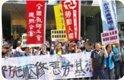
4月18日抗議外商施壓修惡勞基法