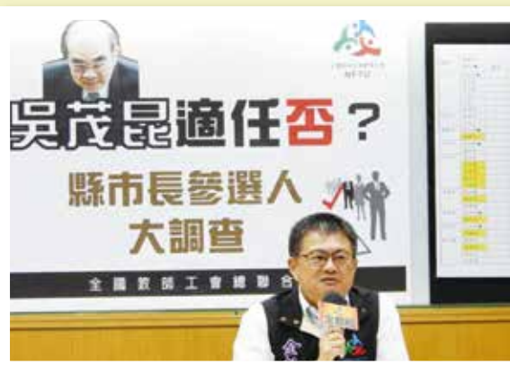
5月15日全教總公布縣市參選人調查 無人認為吳茂昆適任