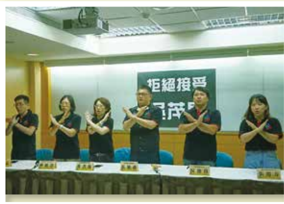
4月30日全教總發起拒絕吳茂昆活動

在一連串的抗爭行動後，吳終在5月29日請辭獲准，結束了41天教育部長任期。回首來時路，我們從理念的凝聚、到高度的共識、最後是大家的覺醒，全教總在此感謝一路走來，相挺相惜的朋友，未來教育路，也讓我們並肩同為信念及價值而努力。