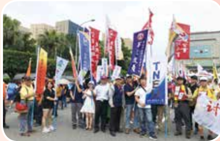
5月1日參加勞動節遊行