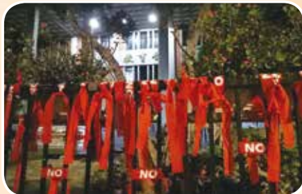
5月18日搶救教育部 捍衛教育的價值