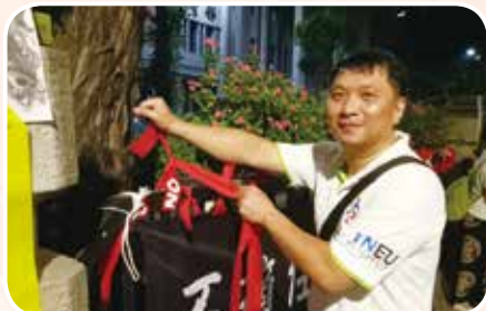
5月18日搶救教育部 捍衛教育的價值