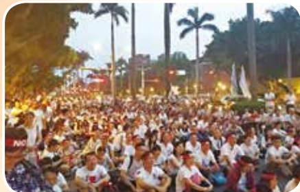
5月18日搶救教育部 捍衛教育的價值