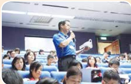
5月30日至桃園培訓專審會人才庫