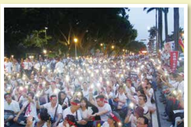
5月18日一齊點亮教育部 捍衛教育的價值