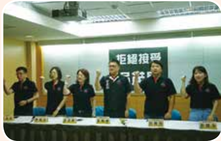
4月30日發起拒絕接受吳茂昆三不運動