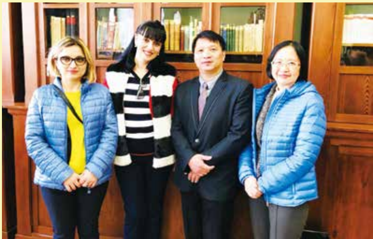
與喬治亞教師工會正副理事長交流