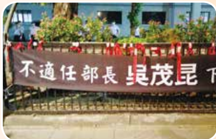
5月18日搶救教育部 捍衛教育的價值