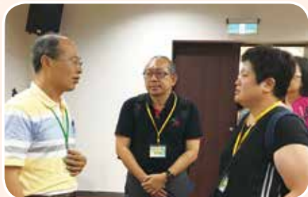
5月26日參加均優論壇與實驗教育推動者對話