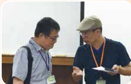
5月26日參加均優論壇與實驗教育推動者對話