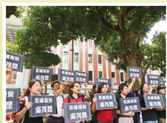
5月16日各縣市教師代表齊聚教育部 拒絕吳茂昆