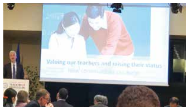
OECD峰會背景文件報告