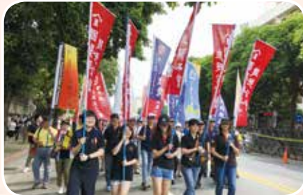
5月1日參加勞動節遊行