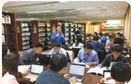
5月3日至桃園培訓專審會人才庫