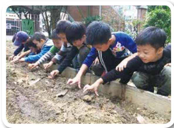
新竹舊社國小播種初體驗