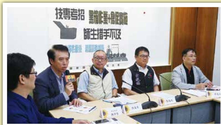
高中職委員會召開記者會要求技專考招新制暫緩實施