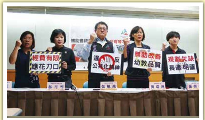
幼教委員會召開記者會監督幼教政策

全教總特委會長期關注全國及地方大大小小特教議題，尤以特教評鑑是特教老師認為最需改善的政策。特委會調查各縣市的特教評鑑指標，八成高達60項以上，部分縣市還破百近兩百項。本會特委會因此召開記者會，特教評鑑是行政減量的最黑暗角落，請教育部督導縣市政府改善，也請大家一起來監督。