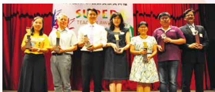
恭喜106年度全國獎及評審團特別獎super教師