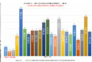
行政減量基層無感