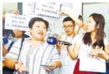
文白爭議不是重點