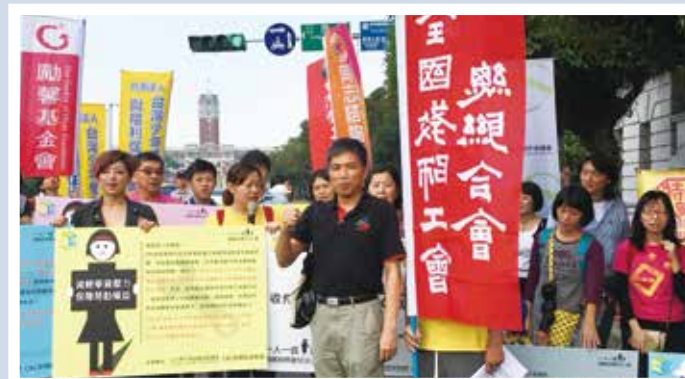
1117落實CRC，一人一信寄總統府記者會

「CRC民間監督聯盟」106.11.17，於總統府前召開「落實CRC，一人一信寄總統府記者會」，本會前往參加，一起和大家維護兒少最佳利益。