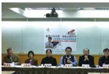
高教問題層出不窮