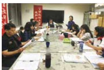
評鑑退場專發正興