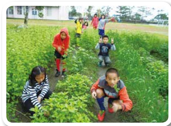
花蓮大榮國小蕎麥田