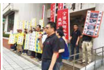
私校退場嚴冬來臨