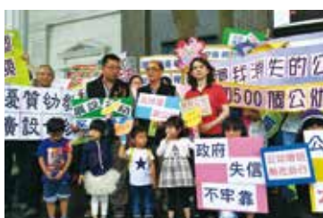
幼教政策百孔千瘡