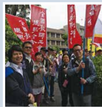
1109全教總與廣大勞工朋友站在一起，反對勞基法惡修