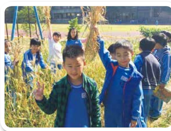
台中鎮平國小雜糧豐收