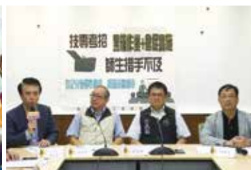
技專考招變革惹議