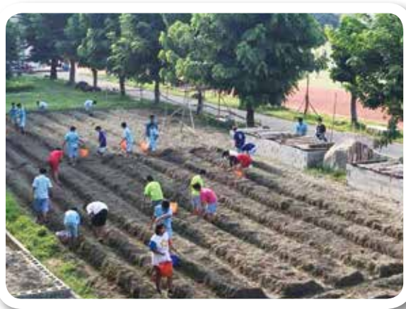
彰化北斗國中 106學年度整地