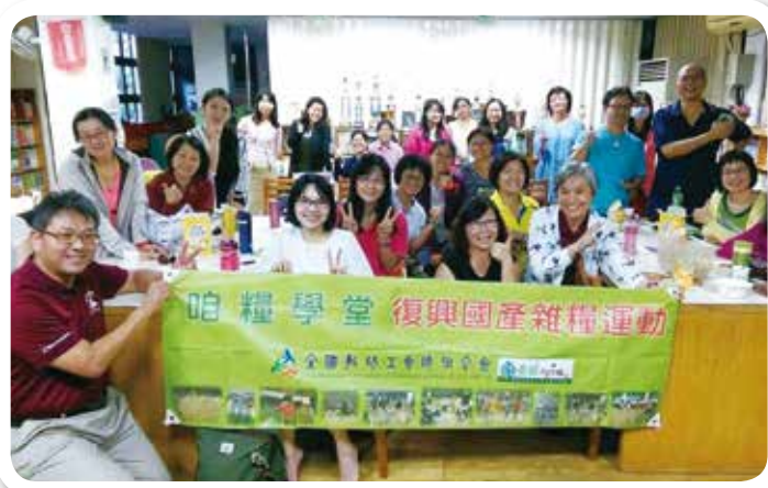
咱糧說明會基隆場