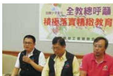
高中人數調降不夠