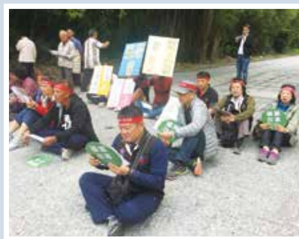
1123聲援反亞泥封路行動