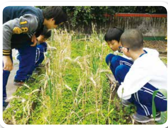
新北市三多國小 105學年度 小麥收成