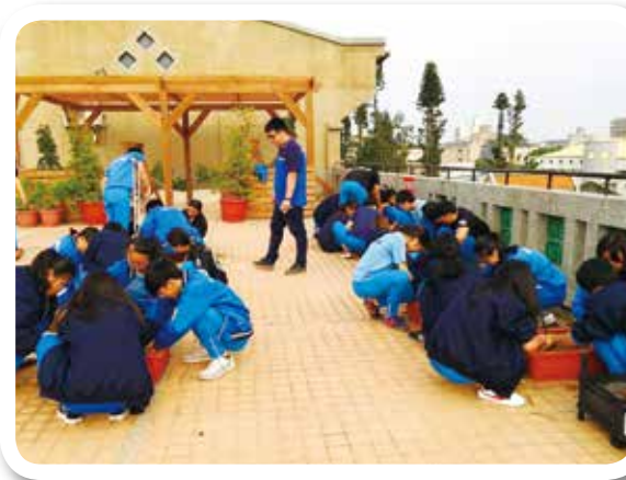
國立金門高中 106學年度播種