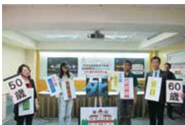
年金改革暫告段落