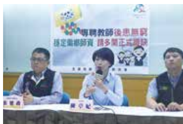
偏鄉條例專聘隱憂