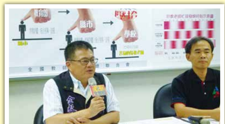
特教委員會召開記者會呼籲政府改善特教評鑑