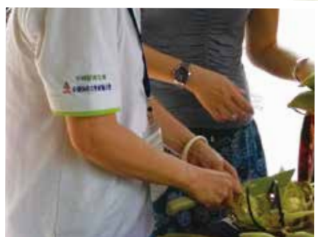
志工工作服袖子上有全教總「不特定志工群」的字樣。