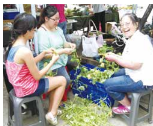
一邊幫忙理菜一邊聊天，是了解農民生活的最佳方式。