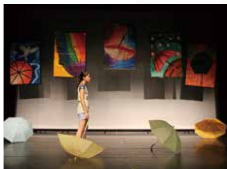
屏東女中從失親家庭討論憂鬱症患者的復原與成長。