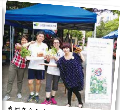
我們在台北公館的「水花園有機農夫市集」服務三年了。