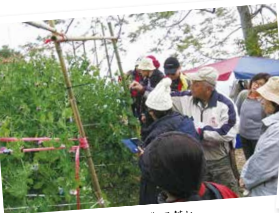
如果你願意，也可以去農場幫忙。