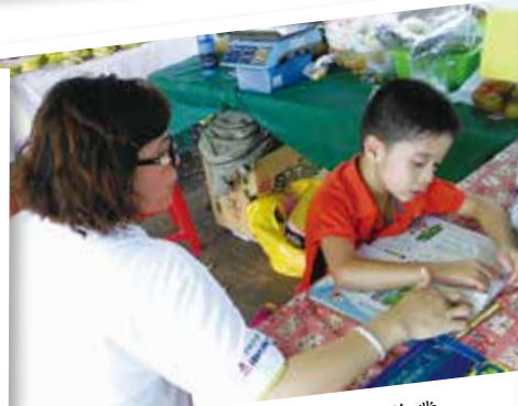
偶爾隨機指導農友的孩子寫作業。