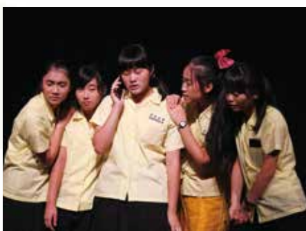
景美女中以戲中戲的方式呈現夢想與現實的拉鋸，將作戲的幕後生活搬上檯面。