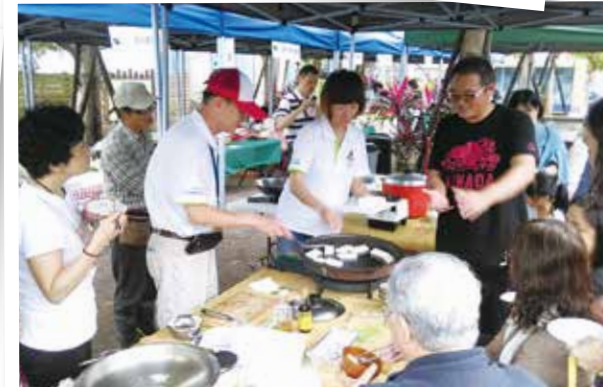
協助市集各種活動：手作蘿蔔糕。