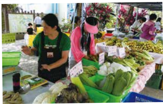
幫忙整理蔬果，回答消費者詢問，秤重、包裝、找錢是基本功。食農教育就在這個過程中進行著。

我們在有機農夫市集服務3年了。在有機市集服務當然跟到傳統市場幫忙不一樣，有機市集的每一筆消費，都象徵著有一吋台灣土地不再受到農藥和化肥的污染。在有機小農市集服務，你的每一分努力都在重新建立生產者和消費者的聯繫，是「食農教育」的最佳體現。