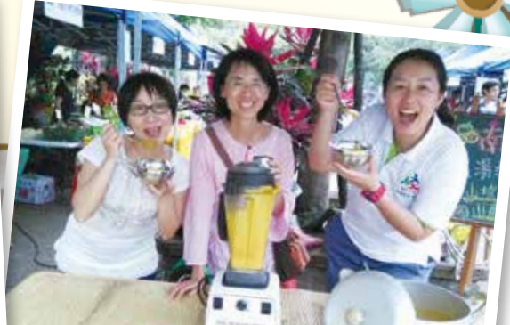
市集最多的是各種料理教學，支援活動當然就順便享受一番。