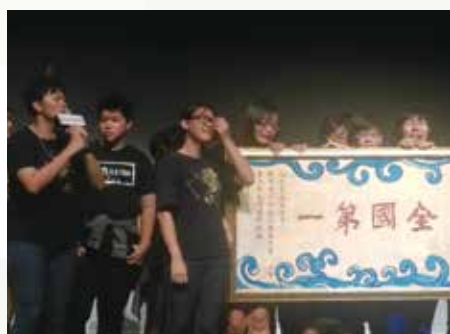
員林高中獲全國第一喜極而泣。