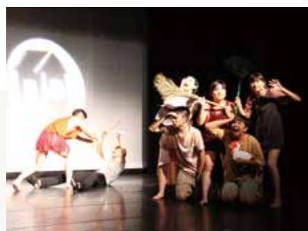
新店高中以奇想情節呈現「每個人都有自己的顏色，每個人都是獨一無二的花」。