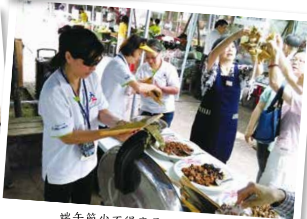
端午節少不得應景活動：包粽子。