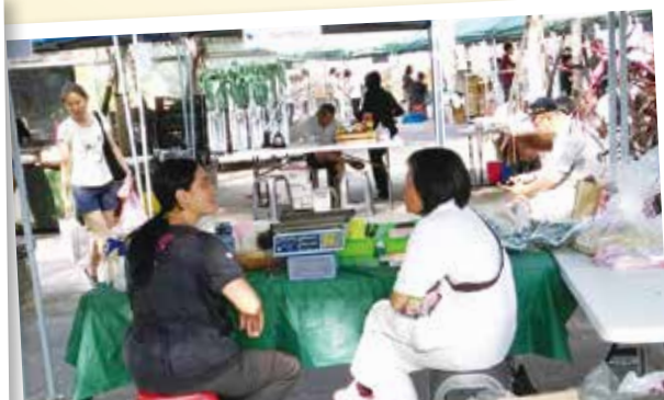
不忙時跟農友聊天是很重要的事，了解農友和他們的農作，消費者多時，志工才能幫忙回答詢問。