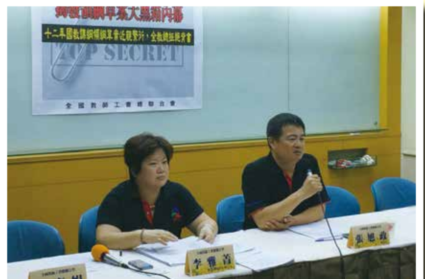
全教總於104年8月15日召開「揭發領綱草案大黑箱內幕」記者會，拒為現階段12年國教領綱草案背書。

依據十二年國民基本教育課程發展委員會領域課程綱要研修小組委員組成及遴聘程序第六點：「各領綱研修小組委員之身分類型與名額如下：(一)課程研發機構代表或課程發展研究會及其相關委員會代表：一至五名。(二)學者專家代表：以