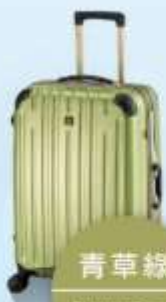
青草綠 Green Grass