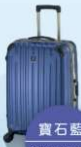
寶石藍 Sapphire Blue