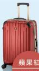
蘋果紅 Apple Red