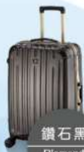
鑽石黑 Diamond Black