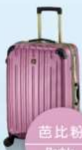
芭比粉 Barbie Powder