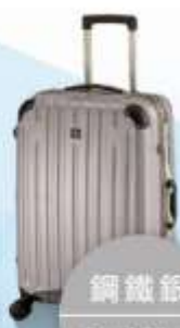
鋼鐵銀 Steel Silver