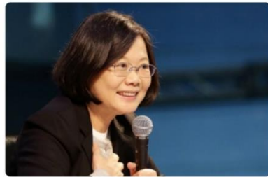
Dr. Tsai Ing-wen President, Taiwan