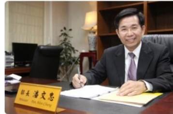
Pan Wen-Chung Minister of Education, Taiwan

台灣蔡英文總統與教育部潘文忠部長為 EI 世界教師日致詞貴賓，與來自全球 173 國家、超過 400 個教師會員組織的政治與工會領袖，共同向教師致敬，感謝教師為孩子學習不因疫情中斷的付出與奉獻。