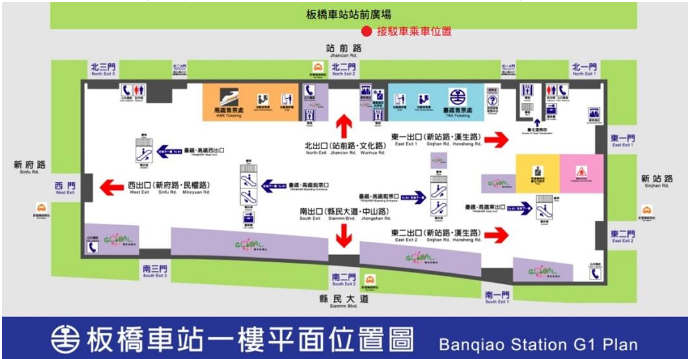
板橋車站一樓平面位置圖 Banqiao Station G1 Plan