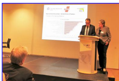
會前活動：德國兩大教師工會理事長 分享德國教育體制