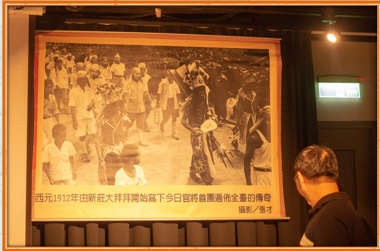
西元1912年由新莊大拜拜開始寫下今日官將首團遍佈全臺的傳奇

西元1912年新莊大拜拜，開始出現官將首的陣頭，新莊地藏庵即是台灣官將首的起源地。